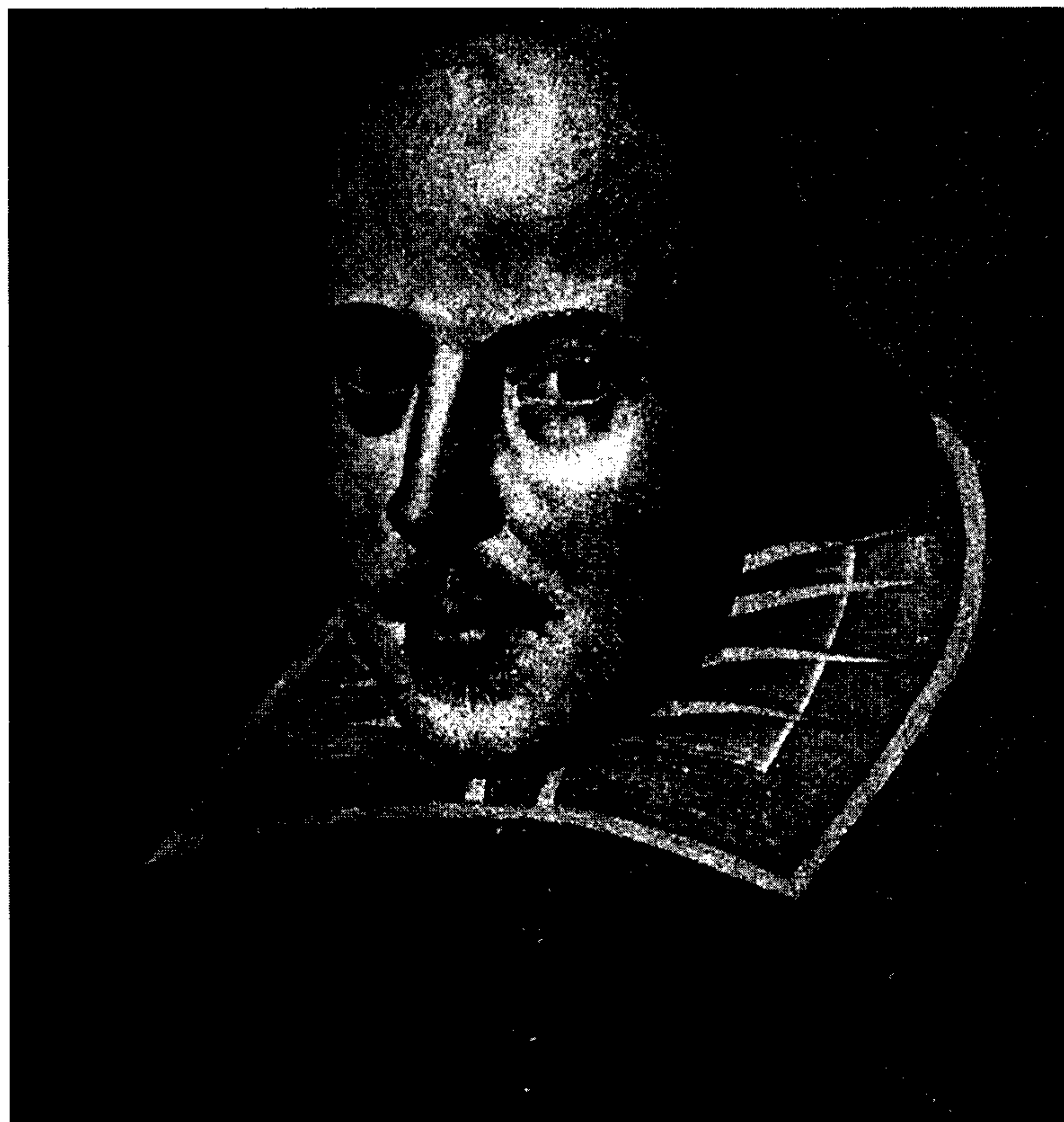
Un ritratto di William Shakespeare